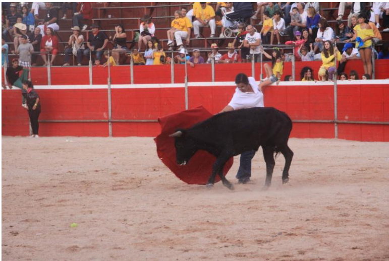
Puri a la muleta recordando tardes de gloria. Gracias por tu apoyo incondicional.